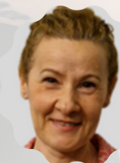
ELENA PIAGGI ILE DE FRANCE